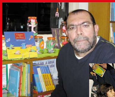
Lalau é o autor de "O Caçador de Palavras".

O projeto integra atividades de interpretação de texto com artes plásticas e conclui o ciclo da 1ª série.