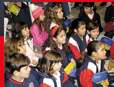
Alunos acompanham atentos o contador de histórias.