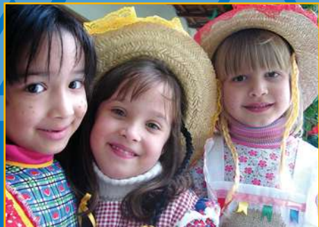
A Festa Junina dos alunos do Ensino Fundamental e da Educação Infantil.