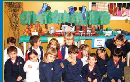
Em sala de aula, os alunos do Alfa II discutiram sobre a extinção de animais.