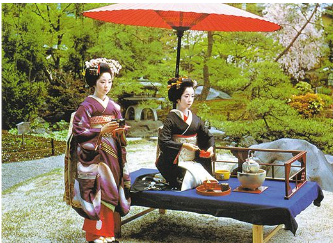
Chadô: Cerimônia do Chá

Na próxima edição do InfoVértice: Como modificar comportamentos?