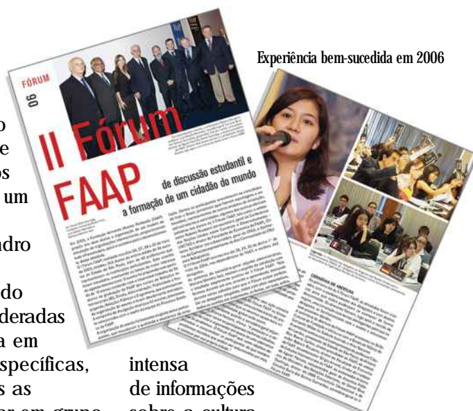
Experiência bem-sucedida em 2006