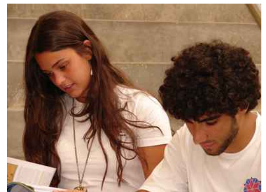
Alunos do Vértice participam da sessão de fotos para matéria publicada na Folha de São Paulo

nossos alunos. "Não há mágica. O resultado do ENEM é uma consequência e não um objetivo em si", afirma Victor Koloszuk, diretor do Vértice. "Ele comprova o sucesso do projeto pedagógico da escola, alinhado à participação efetiva de pais e alunos", completa.